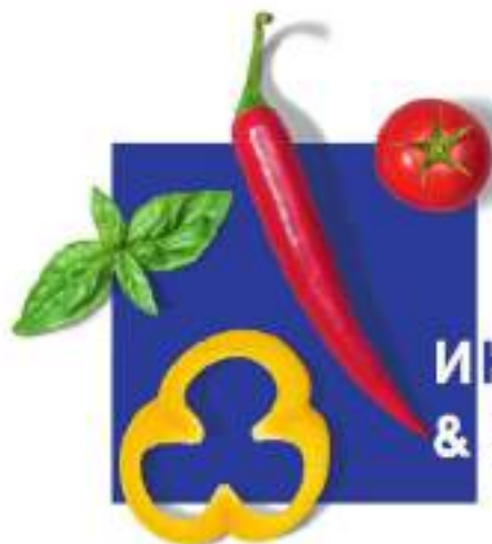
ИНТЕРФУД & ДРИНК